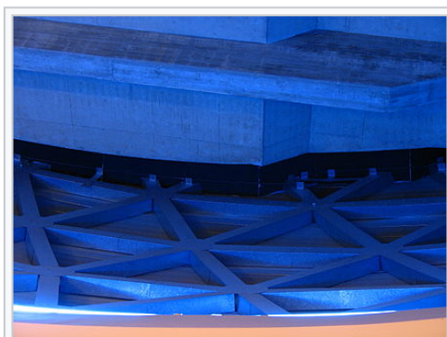
Armature métallique principale, reprenant la structure géodésique des triangles de surface.